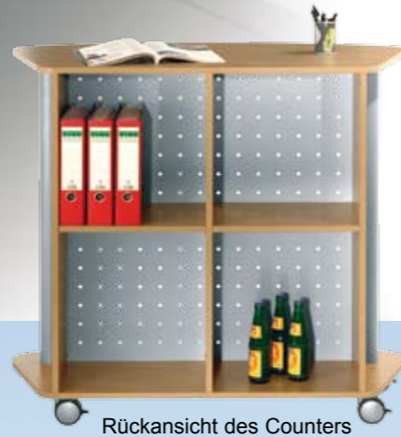
Rückansicht des Counters