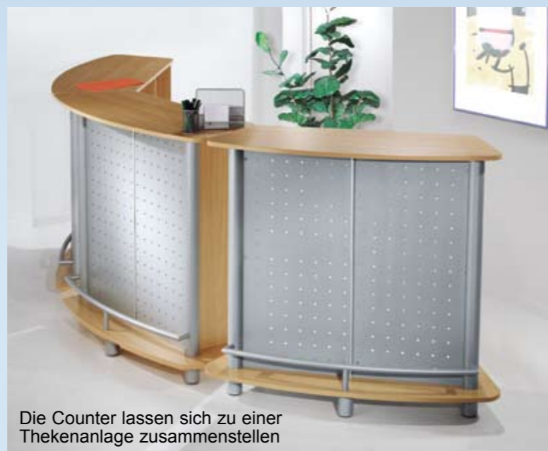
Die Counter lassen sich zu einer Thekenanlage zusammenstellen